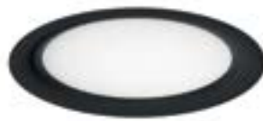
01 Negro / Black / Noir