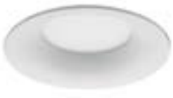
90 Blanco Técnico / Technical White / Blanc Technique