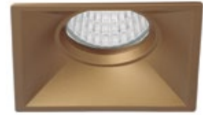
09 Oro Técnico / Technical Golden Or Technique