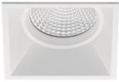
90 Blanco Técnico / Technical White / Blanc Technique