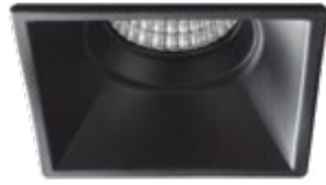
01 Negro / Black / Noir