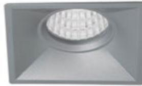
04 Aluminio / Aluminium Aluminium