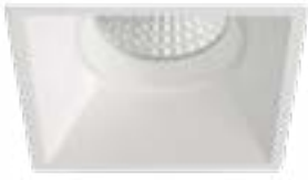
90 Blanco Técnico / Technical White / Blanc Technique