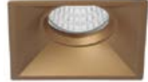
09 Oro Técnico / Technical Golden Or Technique