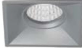
04 Aluminio / Aluminium Aluminium