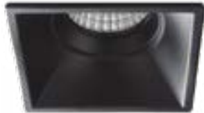
01 Negro / Black / Noir