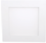
90 Blanco Técnico / Technical White / Blanc Technique