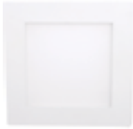
90 Blanco Técnico / Technical White / Blanc Technique