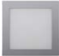
04 Aluminio / Aluminium / Aluminium