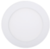
90 Blanco Técnico / Technical White / Blanc Technique