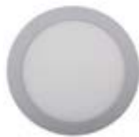
04 Aluminio / Aluminium / Aluminium